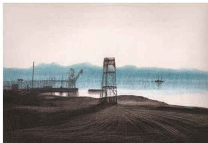
DESSIN AMBROISE HÉRITIER