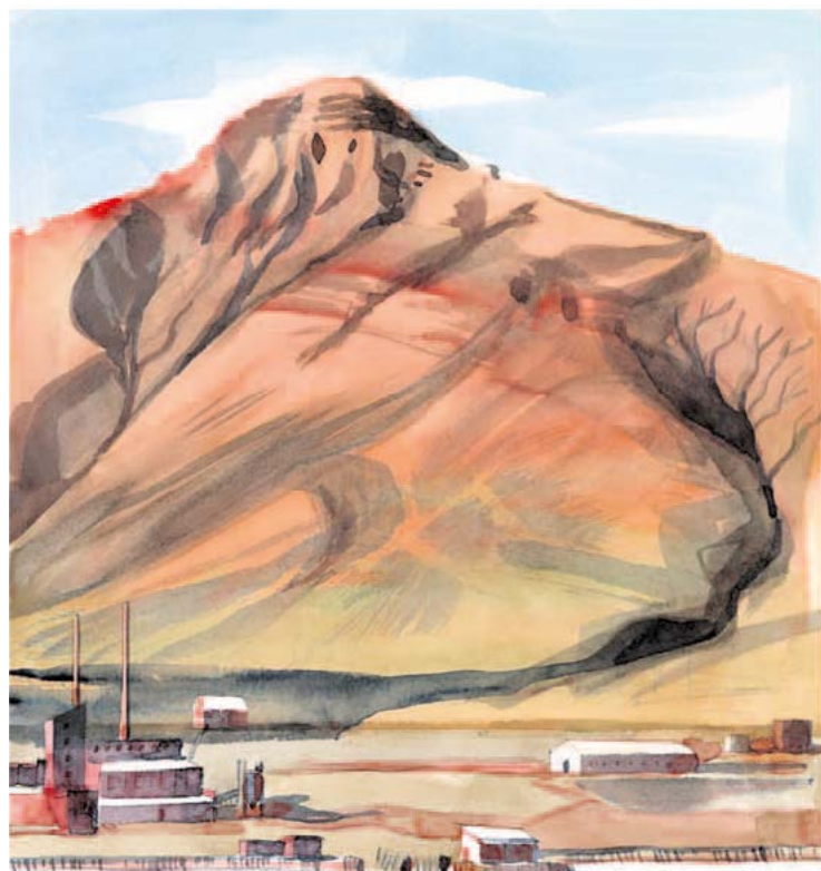
DESSIN MATTHIEU BERTHOD

Sillages, couverture annuelle illustrée et poétique des expéditions Arctique et mer Rouge. Parution du numéro 1 en juin 2021. fondationpacifique.org/sillages